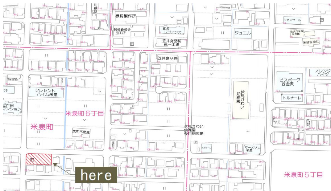
※2枚目に広域地図あります