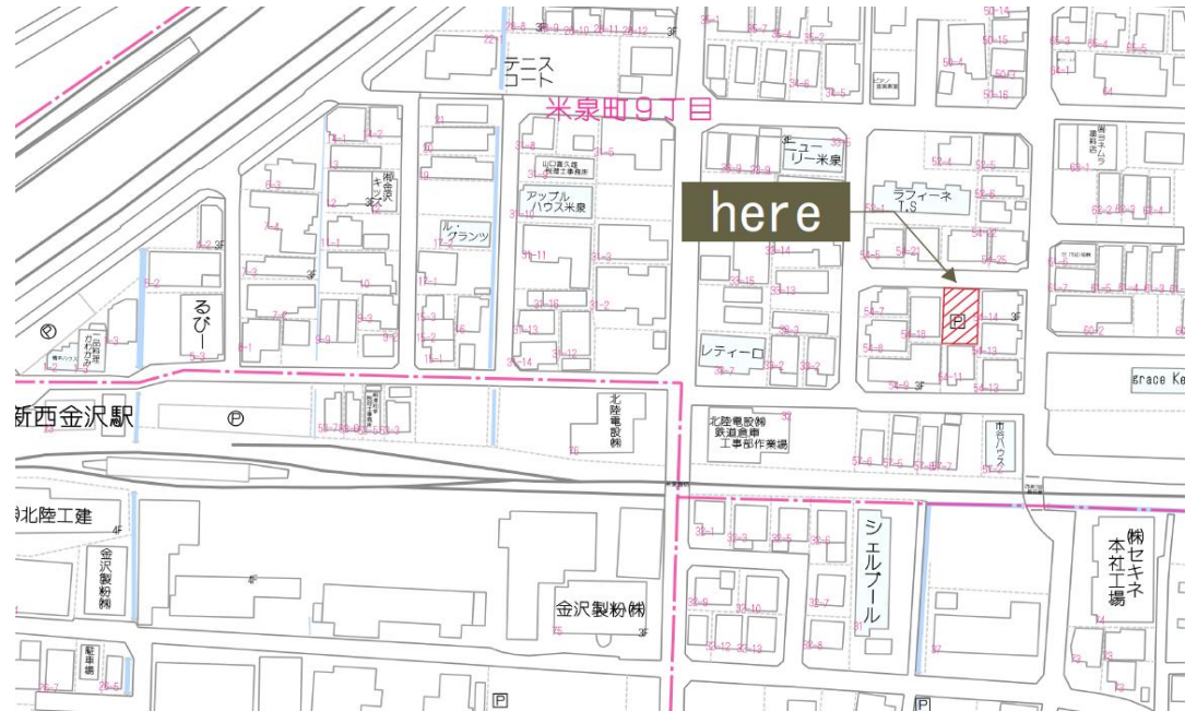
※2枚目に広域地図あります