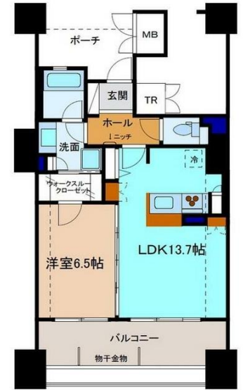
※2枚目に広域地図あります